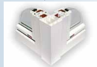
spoj dvou oken pod 90° úhlem