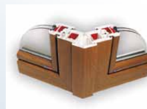
spoj dvou oken pod 135° úhlem