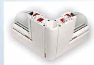
kloubové spojení pro libovolný úhel mezi okny